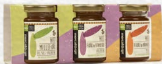
SELEZIONE DI MIELI MONOFLORA E MILLEFIORI BIO - 375 GR