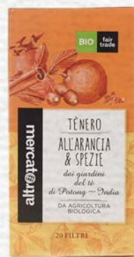
TÈ NERO ALL'ARANCIA E SPEZIE 20 FILTRI BIO - 40 GR