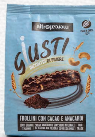
BISCOTTI CON CACAO E ANACARDI 300 GR