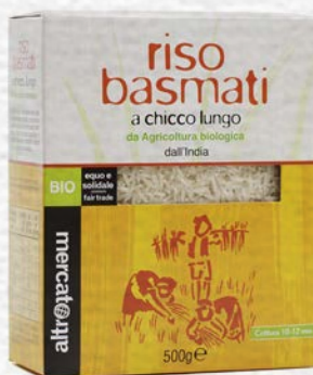
RISO BASMATI CHICCO LUNGO BIO - 500 GR