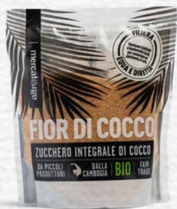
ZUCCHERO DI COCCO BIO - 250 GR