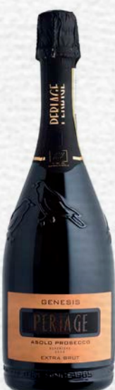
GENESIS - ASOLO PROSECCO SUPERIORE DOGC - EXTRA BRUT - BIO - 750 ML