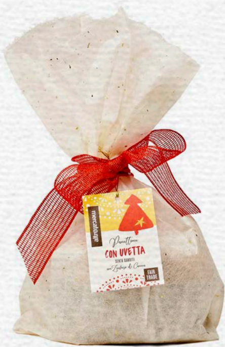
PANETTONE CON UVETTA SENZA CANDITI 700 GR