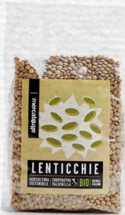
LENTICCHIE ESSIGATE BIO 500 GR