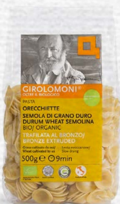
ORECCHIETTE PASTA DI SEMOLA BIO - 500 GR