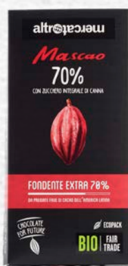
MASCAO CIOCCOLATO FONDENTE EXTRA 70% BIO - 100 GR