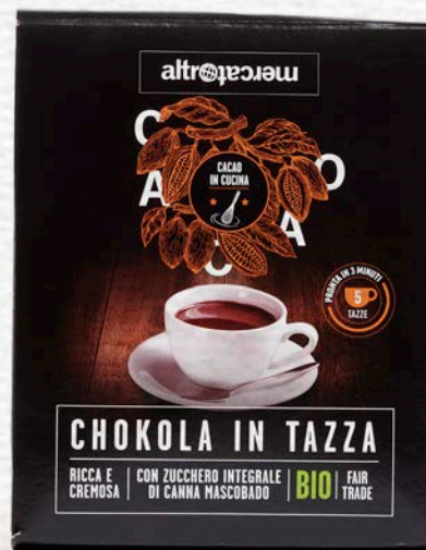
CHOKOLA CIOCCOLATA IN TAZZA BIO 125 GR