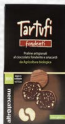
TARTUFI FONDENTI AGLI ANACARDI BIO - 120 GR