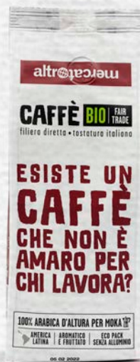
CAFFÈ MANIFESTO MISCELA 100% ARABICA BIO - 250 GR