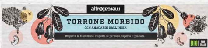
TORRONE MORBIDO CON ANACARDI TOSTATI BIO - 90 GR