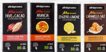
MASCAO CIOCCOLATO FONDENTE EXTRA - FAVE - ARANCIA - ZENZERO E LIMONE CIOCCOLATO AL LATTE - CON CARAMELLO E SALE BIO-100 GR