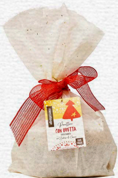
PANETTONE CON UVETTA SENZA CANDITI 700 GR