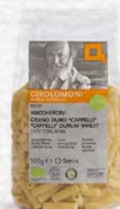
MACCHERONI GRANO DURO CAPPELLI - BIO - 500 GR