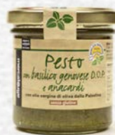
PESTO DI BASILICO DOP E ANACARDI 130 GR