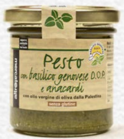
PESTO DI BASILICO DOP E ANAGARDI 130 GR