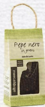
PEPE NERO IN GRANI 30 GR