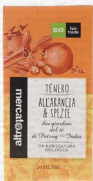
TÈ NERO ALL'ARANCIA E SPEZIE 20 FILTRI BIO - 40 GR