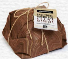
PANETTONE FARCITO CON CREMA GIANDUIA 750 GR