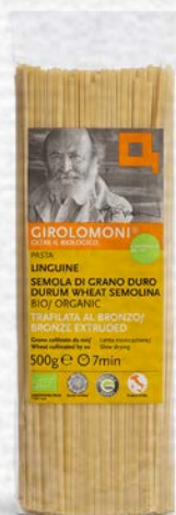
LINGUINE PASTA DI SEMOLA BIO - 500 GR