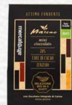
MASCAO - ATTIMO FONDENTE MINI CIOCCOLATO 3 GUSTI BIO - 130 GR