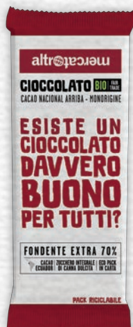
CIOCCOLATO MANIFESTO FONDENTE EXTRA 70% BIO 100 GR