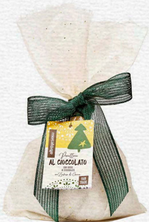
PANETTONE AL CIOCCOLATO CON GOCCE DI CIOCCOLATO 700 GR