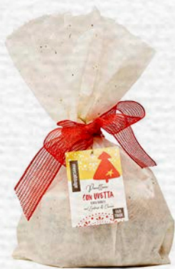
PANETTONE CON UVETTA SENZA CANDITI 700 GR