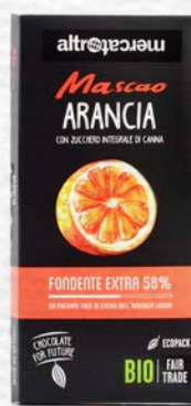
MASCAO CIOCCOLATO FONDENTE EXTRA ALL'ARANCIA BIO - 100 GR