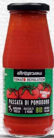
PASSATA DI POMODORO BIO - 280 GR