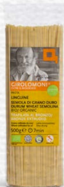
LINGUINE PASTA DI SEMOLA BIO - 500 GR