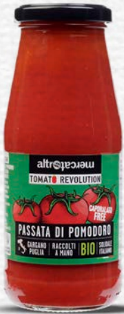
PASSATA DI POMODORO BIO - 280 GR