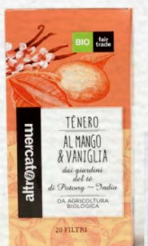
TÈ NERO AL MANGO E VANIGLIA 20 FILTRI BIO - 40 GR