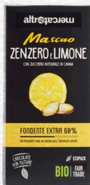
MASCAO CIOCCOLATO FONDENTE EXTRA ZEN- ZERO E LIMONE BIO - 100 GR