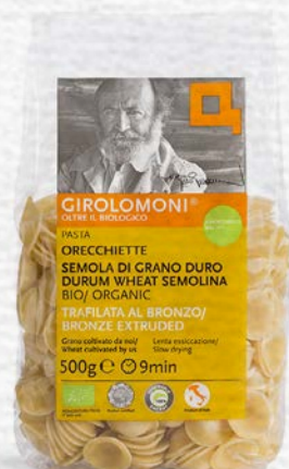
ORECCHIETTE PASTA DI SEMOLA BIO - 500 GR