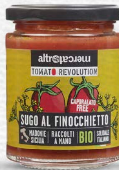
SUGO AL FINOCCHIETTO E POMODORO SICILIANO BIO - 280 GR