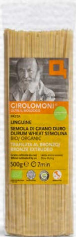
LINGUINE PASTA DI SEMOLA BIO - 500 GR