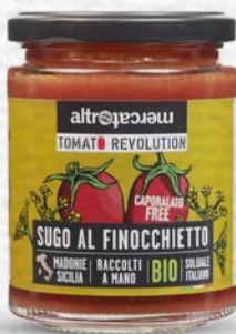
SUGO AL FINOCCHIETTO E POMODORO SICAGNO BIO - 280 GR