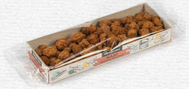
MANI ARACHIDI PRALINATE 100 GR