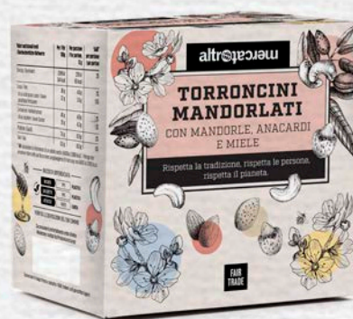
MANDORLATINI CROCCANTI CON MANDORLE E ANACARDI TOSTATI 120 GR