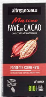
MASCAO CIOCCOLATO FONDENTE EXTRA CON FAVE DI CACAO BIO - 100 GR