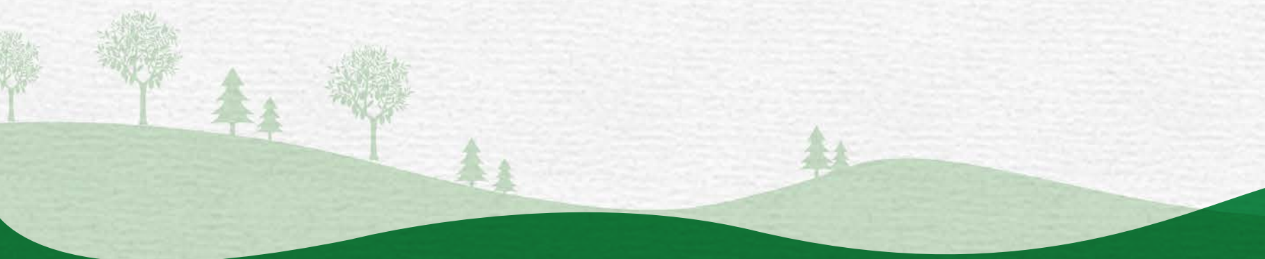
Art Direction: Simona Placci Copywriter: Federico Maria Leone Impaginazione: Giulia Gatti Progettazione: Marco Fiorentino