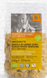
ORECCHIETTE PASTA DI SEMOLA BIO - 500 GR