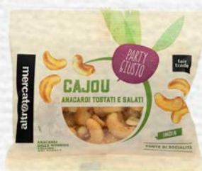
CAJOU ANACARDI TOSTATI E SALATI 50 GR