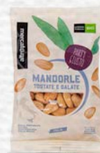
MANDORLE TOSTATE E SALATE BIO - 100 GR