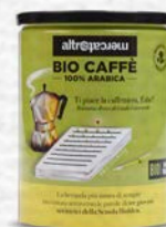
CAFFÈ 100% ARABICA IN LATTINA BIO - 250 GR