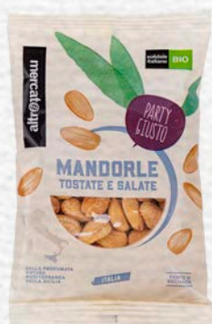
MANDORLE PELATE DI SICILIA BIO - 100 GR