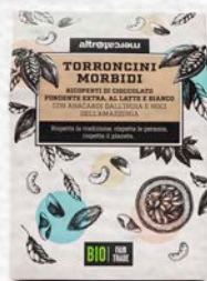
TORRONCINI MORBIDI RICOPERTI BIO - 180 GR