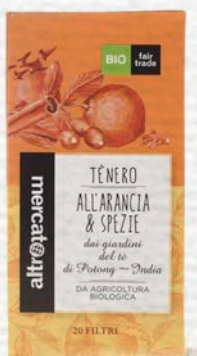
TÈ NERO ALL'ARANCIA E SPEZIE 20 FILTRI BIO - 40 GR