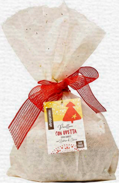
PANETTONE CON UVETTA SENZA CANDITI 700 GR