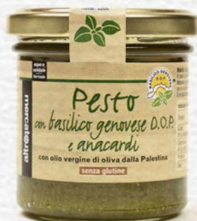
PESTO DI BASILICO DOP E ANACARDI 130 GR