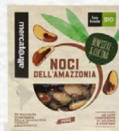
NOCI DELL'AMAZZONIA SGUSCIATE BIO - 150 GR