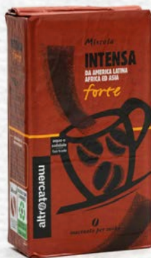
MISCELA INTENSA MACINATO PER MOKA 250 GR