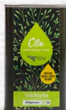
OLIO EXTRA VERGINE D'OLIVA SICILIA BIO - 500 ML