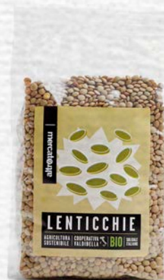
LENTICCHIE ESSICcate BIO 500 GR