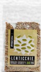
LENTICCHIE ESSICcate BIO 500 GR