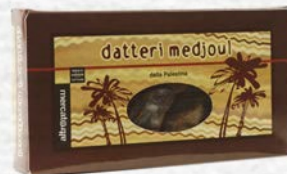
DATTERI MEDJOU AL NATURALE 200 GR