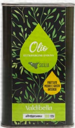
OLIO EXTRAVERGINE D'OLIVA SICILIA 500 ML