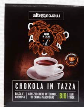
CHOKOLA CIOCCOLATA IN TAZZA BIO - 125 GR